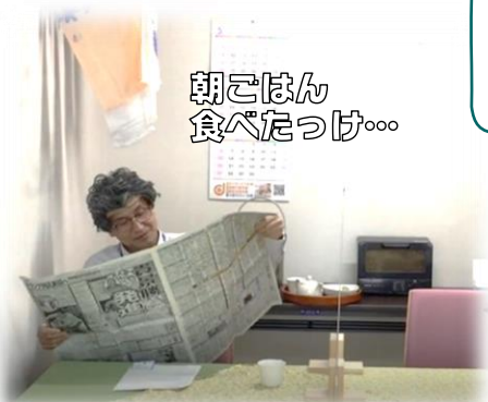
朝ごはん 食べたっけ…