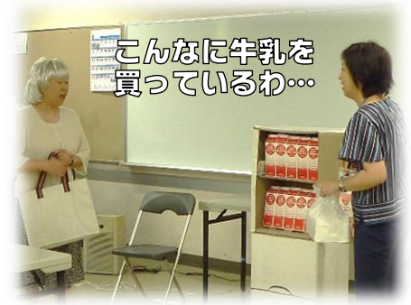
こんなに牛乳を 買っているわ…