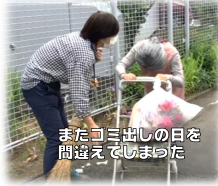
またゴミ出しの日を 間違えてしまった

認知機能が低下し、自宅での生活 が不安になったが、身寄りがな く、施設入所の契約ができない