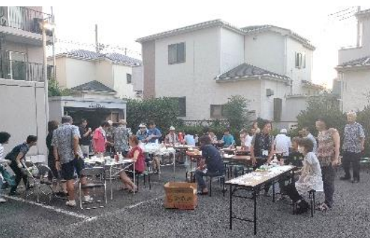
▲駐車場でバーベキュー

自治会活動は、コロナ以降中断していた住民の集いとしてバーベキューを開催。また県の防災センター見学ツアーを敢行。年1回の防災訓練は例年40名程度の住民が参加。餅つき会の開催も今後検討とのことでした。