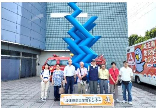
▲県の防災センター見学

月1回、イトーヨーカドーや希望の場所に行っています。参加者は日によって違いますが、3～4人。多くても車2台位。この前で33回目になりました。マンション内にチラシを掲示して宣伝しています。活動はいいねと評価してもらっています。続けていけば、いいこともあるかなと思って。体が続く限りやりたいと思っています。