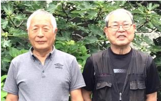
▲原田会長(左)と藤田副会長(右)