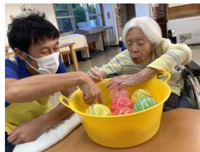
【12月:年末お楽しみ会】